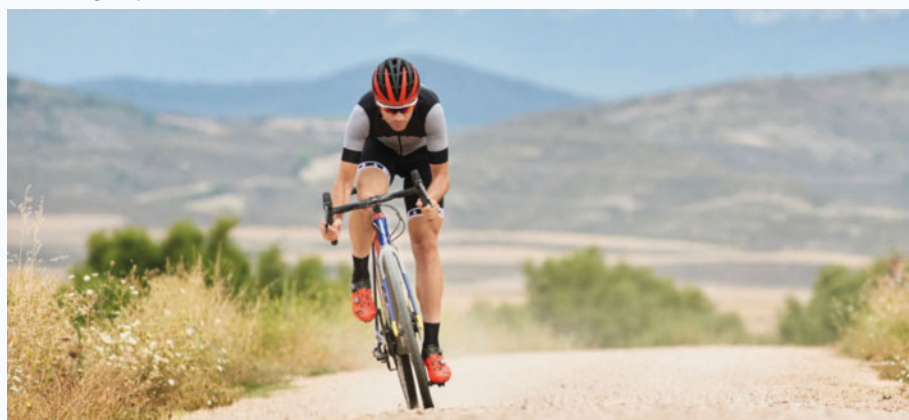
Javier Gómez Noya 5x Campeón del Mundo